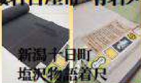
新潟十日町 塩沢物帯着尺

正絹振袖・正絹訪問着・正絹色無地 西陣織袋帯・博多織名古屋帯・有名メーカー品 全国産地紬など