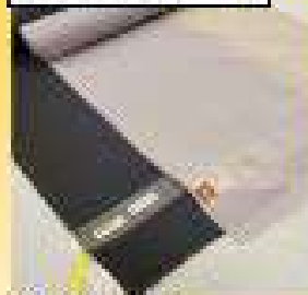
トースターコート

コートや羽織には防 凍の需要合いもあり ますが、大切な着物 や帯を守ることやファ ッションや礼儀の需要 もあります。 この秋冬に向けて 兼重四日市店にて 羽織・コート向きの着 物を一堂に持参させ ます