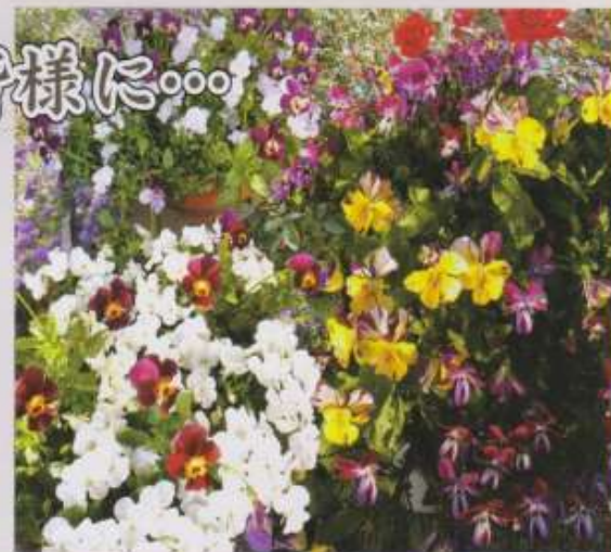
写真の花はイメージです

期間中にご来場頂いた方に、可愛いプラントポットを1ポットプレゼント致します。お花の種類はいろいろあります。