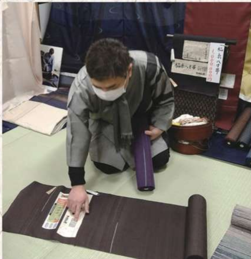
氏が手掛けた作品の数々がズラリと並びます